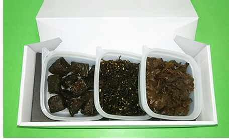
バイopakKT85-80 鮎、ごま昆布、アサリの佃煮 40g