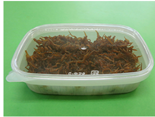
バイopakC-中350 ぐし煮 100g