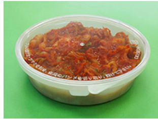
バイopakCK150-450 キムチ 320g