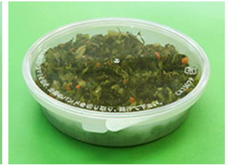
バイopakCK150-450 野沢菜昆布 250g

この『バイopakシリーズ』は、「石油由来のポリプロピレン(PP)70%」に、 サトウキビの「廃糖蜜(はいとうみつ:砂糖を精製する時に発生する副産物)」を発酵させてつくられた バイオエタノールが原料の「植物由来のポリエチレン(バイオPE)30%」を配合した、環境に配慮した容器です。