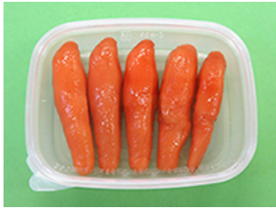
バイopakC-中350 明太子 200g