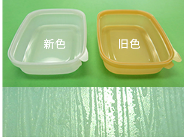
木目調 アップ画像