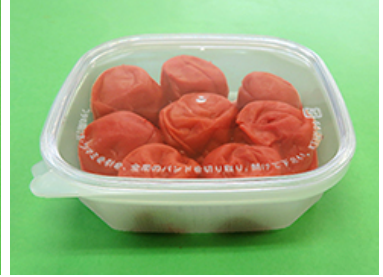
バイopakKT125-300 梅干し 180g