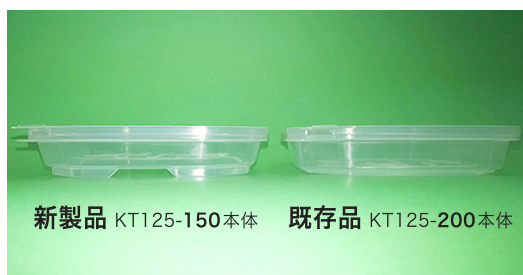
新製品 KT125-150本体 既存品 KT125-200本体