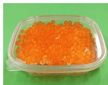
使用例 KT125-150 いくら 80g