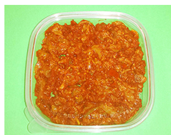
使用例 KT125-150 チャンジャ 80g