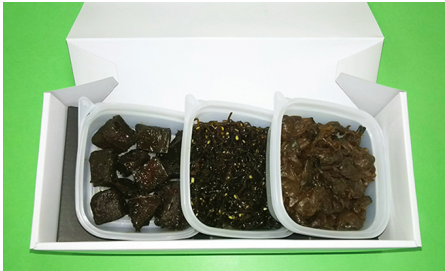
鮭、ごま昆布、アサリの佃煮 40g