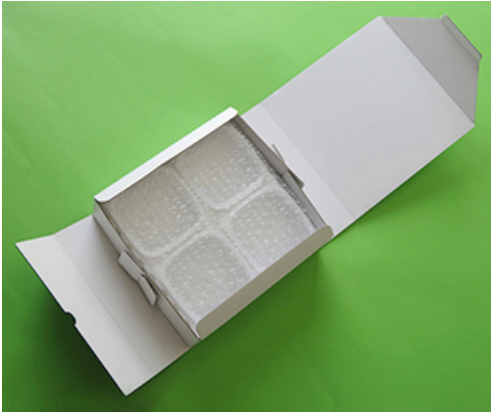
4個入り (気泡緩衝材あり)