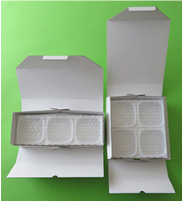
3個入りと 4個入り (気泡緩衝材あり)