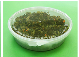
バイオCK150-450 野沢菜昆布 250g

この『バイオパックシリーズ』は、「石油由来のポリプロピレン(PP)70%」に、サトウキビの「 廃糖蜜(はいとうみつ:砂糖を精製する時に発生する副産物) 」を発酵させてつくられたバイオエタノールが原料の「植物由来のポリエチレン(バイオPE)30%」を配合した、環境に配慮した容器です。