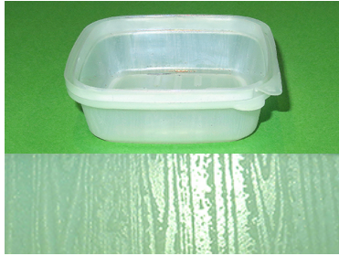
木目調 アップ画像