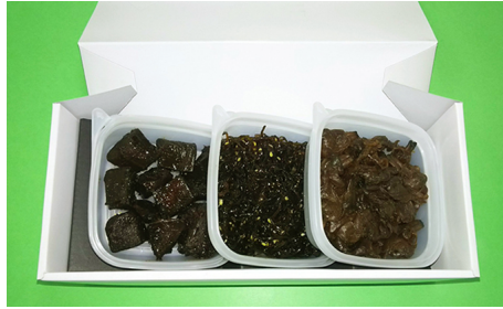
バイオKT85-80 鮎、ごま昆布、アサリの佃煮 40g