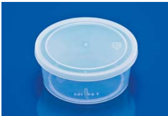
T88-150 〈フィルムシール対応品〉